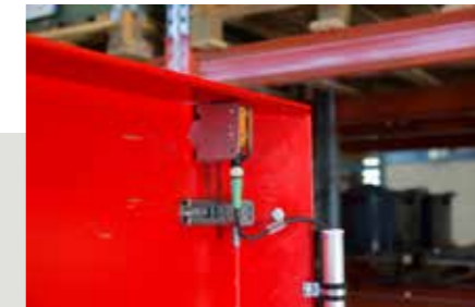
Yliäytönanturi S ja M -yksiköille asennettuna turvaseinän jatkeeseen