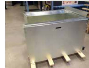
Saatavilla myös galvanoidut tai ruostumattomasta teräksestä valmistetut versiot. Kysy tarjous erikseen.