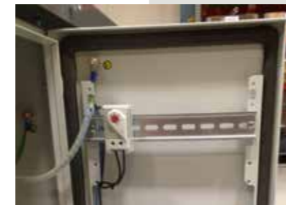
Pakkasvahti sähköisiin laitteisiin, joita käytetään viileissä/kylmissä olosuhteissa. Pitää laitteen toimintakuntoisena aina -25C asti.