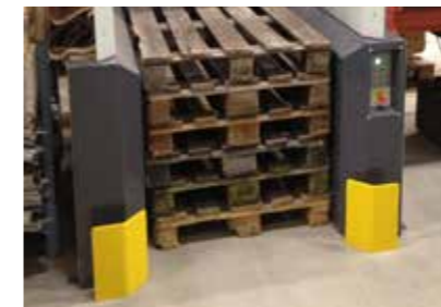
Haarukkatrukin suojaeste etukulmiin. 1 setti sisältää kiinnitysankkurit.