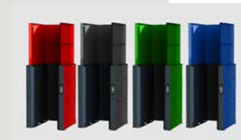
Sivupaneelien ja turvajatkeen vakiomaalaukset ovat RAL 3020 ja RAL 7035. Peruskone on vakiona RAL 7024. Saatavana myös muita RAL-standardin värejä.