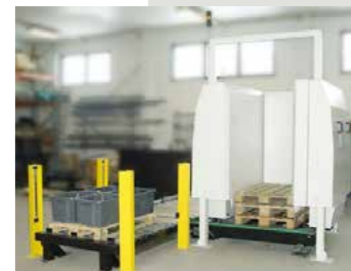
Saatavilla on myös malleja järjestelmäintegraattoreille.