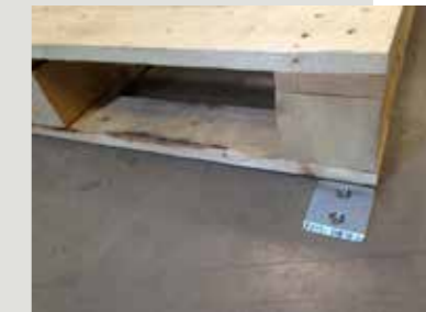
Lattialle asennettavat pysäytyslevyt CHEP-lavojen käsittelyyn.